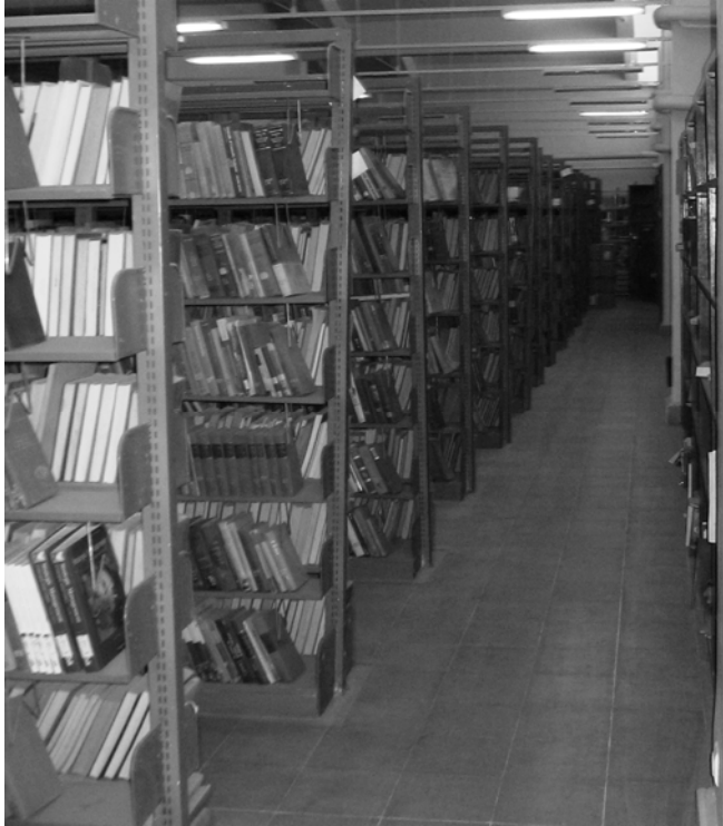
مجموعه کتب که در کتابخانه پوهنتون کابل ذخیره شده است

کتابخانه واحد تحقیق و ارزیابی افغانستان در جریان ۶ سال اخیر نشریات مخصوص افغانستان را جمع آوری نموده و در حال حاضر مجموعه های از نسخه های سابق و جدید را ذخیره نموده که این نسخه ها شامل بسته های اسناد بودجوی از سال ۲۰۰۲ الی ۲۰۰۷، چاپ های تجدید شده احکام قانون، نشریات احصائیوی دولت و کاپی های الکترونیک قوانین مندرجه جریده رسمی ماده های ۱ الی ۹۰۰، می شود. این کتابخانه در حال حاضر در صدد جمع آوری مطالب و اطلاعات به زبان های دری و پشتو می باشد. دسته از دایرة المعارف (دانشنامه) ایرانیکا (نسخه ۱ الی ۱۳) اهدا شده به این کتابخانه از جمله منابع عمده علمی می باشد. فرهنگ و جریشه شناسی زبان پشتو، فعالیت های تاریخی حسن کاکر، و رسالات علمی چاپ نشده موسسه ProQuest مثالهای از نشریات بین المللی منتخب می باشد که به منظور به دسترس گذاشتن نسخه های آن در افغانستان وارد گریده است.