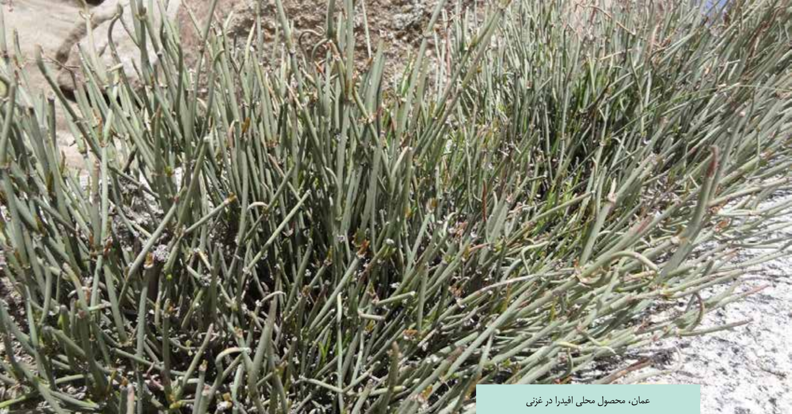
عمان، محصول محلی افیدرا در غزنی

در آخر، گزارش دولت ایالات متحده مبنی بر افزایش کشت کوکنار در افغانستان بین سال های ۱۹۹۴ و ۱۹۹۵ از ۲۹،۱۹۰ هکتار به ۳۸،۷۴۰ هکتار، با رشد میزان کشت در قندهار (از ۲،۶۶۶ هکتار به ۳،۰۵۰ هکتار)، در ارزگان (از ۳،۲۹۳ هکتار به ۳،۶۴۰ هکتار) و رشد قابل ملاحظه در هلمند (از ۱۲،۵۲۹ هکتار به ۲۲،۷۰۰ هکتار)، قابل تردید است ۱۹ ؛ نه برآورد دولت ایالات متحده و نه برآورد دفتر مقابله با مواد مخدر و جرایم سازمان ملل متحد نشان می دهد که افزایش قابل ملاحظه کشت کوکنار بین سال های ۱۹۹۵ و ۱۹۹۶ ناشی از رفع ممنوعیت کشت از سوی طالبان است ۲۰ .