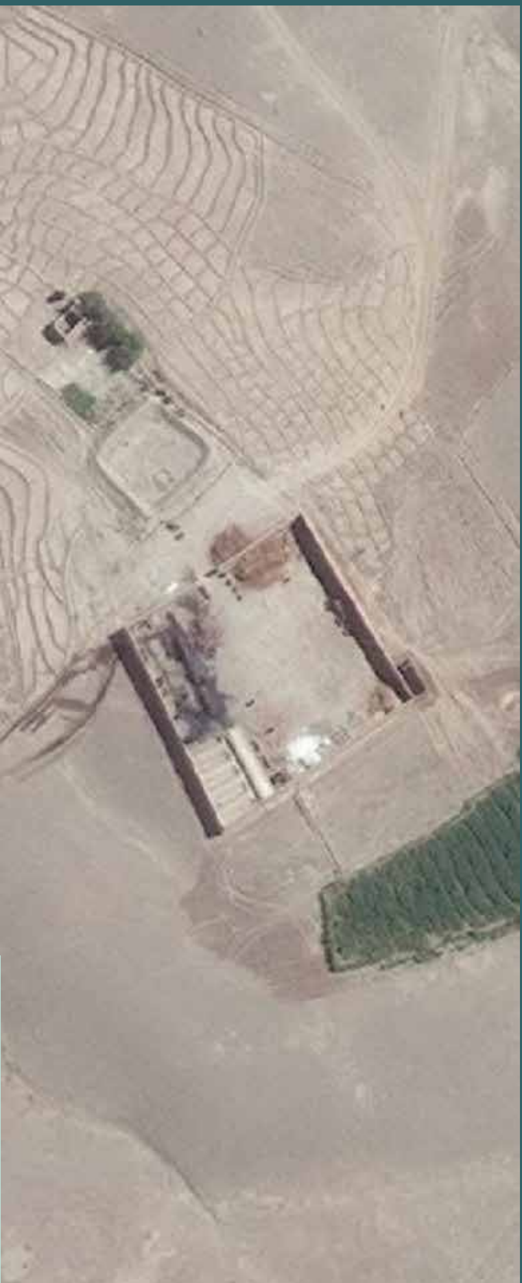
آبپاشگاه هیروئین در منطقه گدم ریز در ولسوالی کبکی هلمند