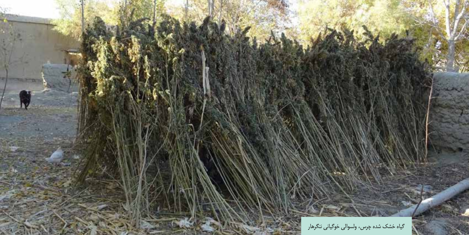
گیاه خشک شده چرس، ولسوالی خوگیانی ننگرهار

علاوه بر این، در جهانی که تولیدات تریاک قانونمند شده است تقاضای بسیار کم برای تریاک خام وجود دارد. کمپنی های کلان داروسازی ترجیح میدهند از کاه کوکنار تغلیظ شده (CPS) استفاده نمایند. ۴۵ کاه کوکنار تغلیظ شده (CPS) با ارائه ۹۵ فیصد مواد خام تریاک غنی شده با مورفین حجم کلان از عرضه جهانی تولیدات تریاک را تشکیل میدهد. ۳۶ همچنان استخراج الکلوئید از کاه کوکنار تغلیظ شده (CPS) دارای ضایعات باقیمانده کمتر نسبت به تریاک خام می باشد و بدین جهت چالشها (و مصارف) و خطرات محیطی آن کمتر می باشد. تولید تریاک با استفاده از کاه کوکنار تغلیظ شده (CPS) به دلایل زیر نیز ترجیح داده میشود: از نگاه اقتصادی نسبت به استخراج تریاک دارای مقیاس اقتصادی چشمگیر می باشد، زمینه های تبدیل آن به بازار غیرقانونی نیز کمتر می باشد، و محصول نهایی آن از نگاه وزن دارای ارزش بالاتر می باشد که بدین جهت مصارف ترانسپورت را کاهش داده و مصونیت آن بیشتر می باشد.