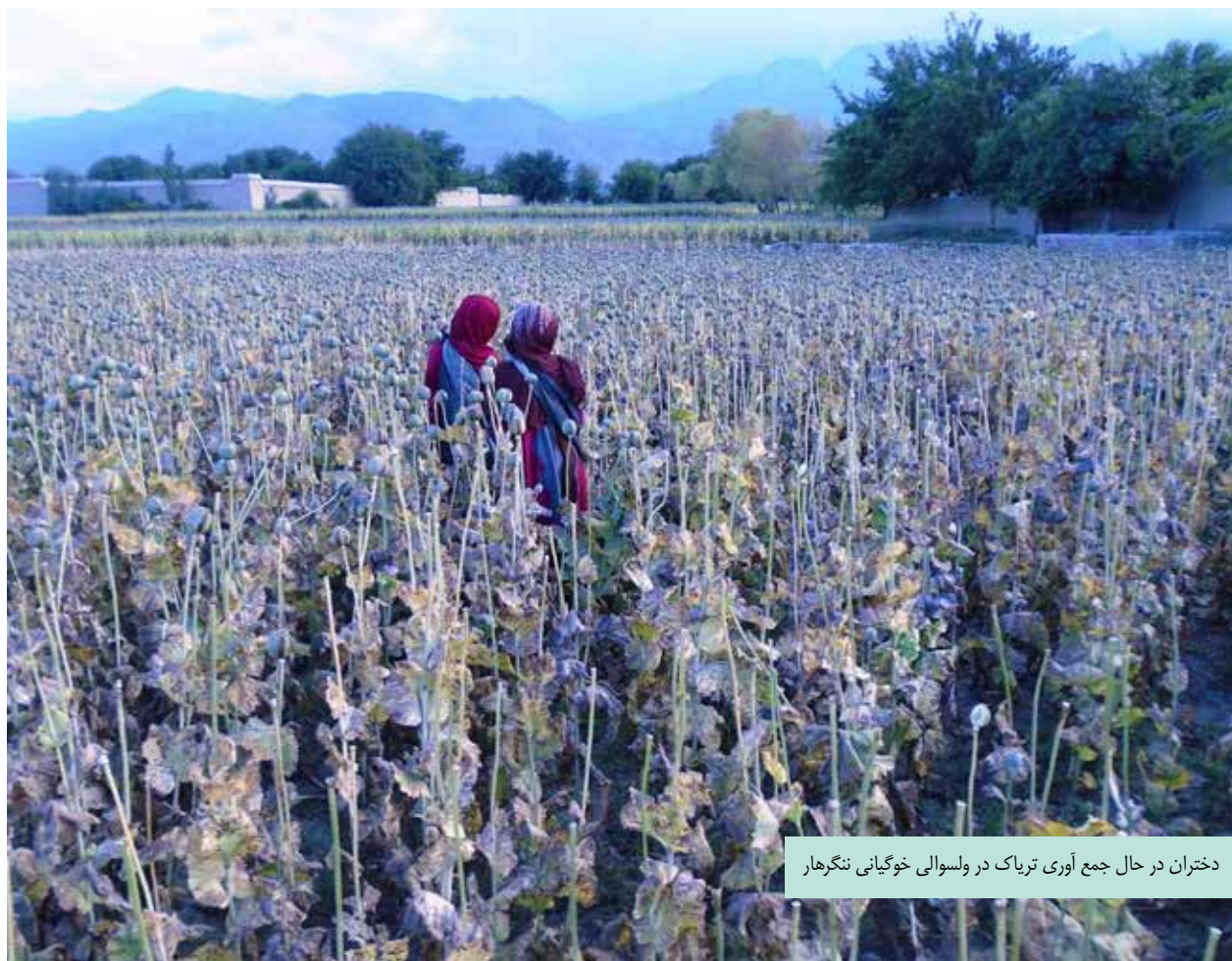
دختران در حال جمع آوری تریاک در ولسوالی خوگیانی ننگرهار

نخست، سروی ۱۹۹۴ دفتر مقابله با مواد مخدر و جرایم سازمان ملل متحد یک مطالعه آزمایشی بود؛ این اولین کاستی تخمین بصری کشت کوکنار از سوی سرویرهای ساحوی است، مطالعه ای که در داخل دفتر ناقص شناخته شده بود؛ مبالغه در حجم کشت کوکنار که تا حدی معطوف به جلب کمک مالی برای سروی و برنامه های آینده بود. کاهش کشت در ۱۹۹۵ تا حدی نتیجه خطا و تغییرات روش شناختی بود؛ دفتر مقابله با مواد مخدر و جرایم سازمان ملل متحد سروی های ۱۹۹۴ و ۱۹۹۵ را مقایسه پذیر ندانسته و گستره نشر آن را محدود در نظر گرفت (UNDCP ۱۹۹۵: ii and ۲).