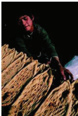
فروش نان یک منبع ناکافی عایداتی برای خانواده های شهر نشین میباشد.

این پالیسی نامه به اینکه افغانهای نه چندان فقیری که در شهرهای بزرگ زندگی می کند چگونه به کسب درآمد می پردازند، چگونه عواید شان را خرج می کنند و همچنین به نمونه های اعتبار و پس اندازهای آنان توجه دارد. این نامه در صفحه ۴ چند پیشنهاد سیاستگذاری در مورد چگونگی کاهش بار عواید پایین و قرض زیاد خانواده های ناتوان و آسیب پذیر، ارائه می کند.