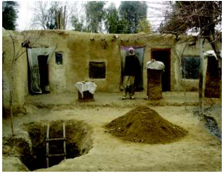
جلال آباد په یو کسپ کې د زیات شمیر غیر رسمي کورونو څخه یو مثال

رسمی کولو لپاره سپارښتنی کړی دی ۲ شواهد ښکاروی چې په ځنو حالاتو کې، په غیر رسمي استوګنو کې میشتو خلکو خپلی منابع د خپلو کورونو په معمارۍ په ښه کولو باندې لګوی دغه کار هغوی ته دا احساس ورکوی چې د ځمکې په نیولو باندې د خپل د حقونو د رافعی قوا ورکړی او په ښاروالۍ باندې فشار راوړی چې دا خلک کولای شي په نیول شوو کورونو کې پاتې شی. په جلال آباد کې یوه سیمه د اشتراکی عمل د قدرت یو ډیر ښه مثال دی وروسته له هغه چې د دغه سیمې خلکو د بله ووزرونو د شړلو په مخه مقاومت ښکاره کړ، هغو له ښاروالۍ او د ښارونو د پرمختګ له وزارت څخه وغوښتل چې د هغوی استوګنې رسمی کړی د ځمکو د قبالة کولو نقشه پیل شوه، که څه هم دغه کار د هغو اوسیدونکو لپاره د یو لوړ قیمت په بیه تمام شو، له کومو څخه چې په زور وغوښتل شوو چې خپل کورونه د همغی سیمې په بل موقعیت کې له سره ودان کړی د دغه سیمې ټولو کورنیو نوی جوړ شوی استوګنځي کې د اوسیدو لپاره پیسې وګټلې د دغه کار په کولو سره هغوی د منظمو اساسی خدمتونو د غوښتلو حق ترلاسه کړو خو بیا هم د یادونې وړ ده چې دغه استوګنه یوازې هغه وخت جوړه شوه کله چې څرګنده شوه چې د ښار د اوسنی ماسټر پلان لپاره د تخصیص شوی ځمکې له سرحدونو څخه بهر وه.