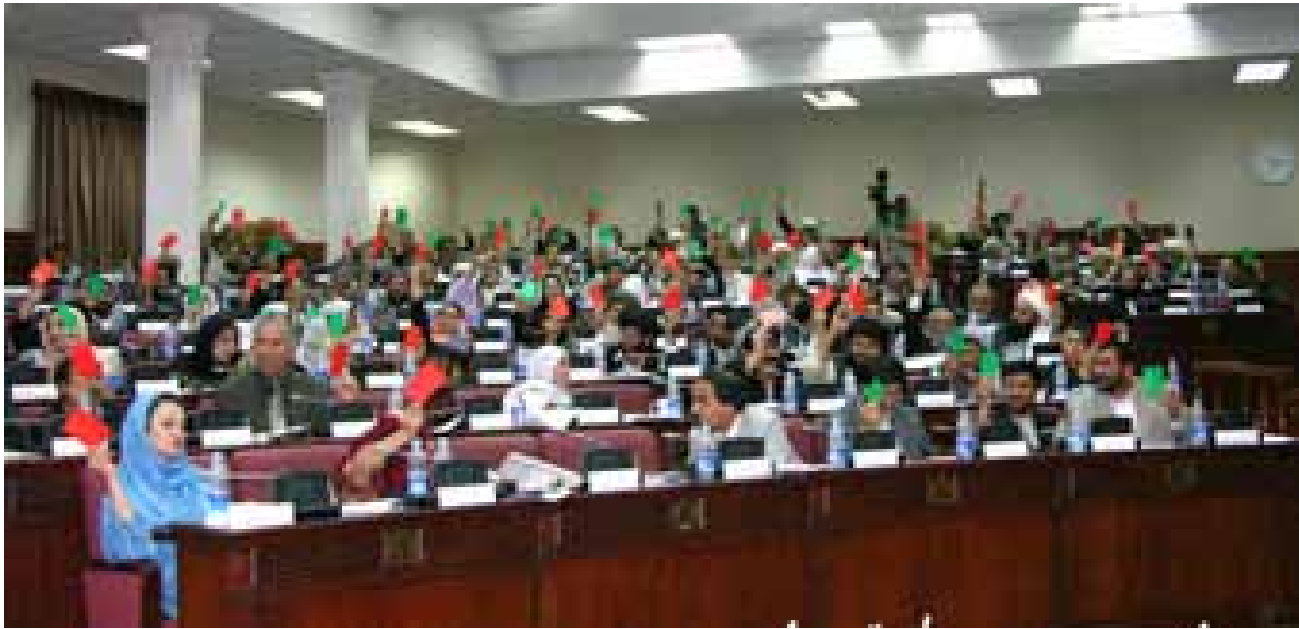
په کورنیو کې د نابرابریو بدلون، پارلمان ته د ښځو د راتگ یوه انگېزه ده

په پای کې پارلمان ته د ښځو د راتگ انگېزې د یوې ټاکلې ډلې د گټو څخه استازیتوب دي. د وردگو د ولایت یوې استازې چې د پارلمان د ځینو غړو د نظرونو انعکاس وه، د نوموړې په ولایت کې د هزاره ښځو اړتیاوې چې نوموړې د هغوي استازیتوب کوي داسې بیان کړې: