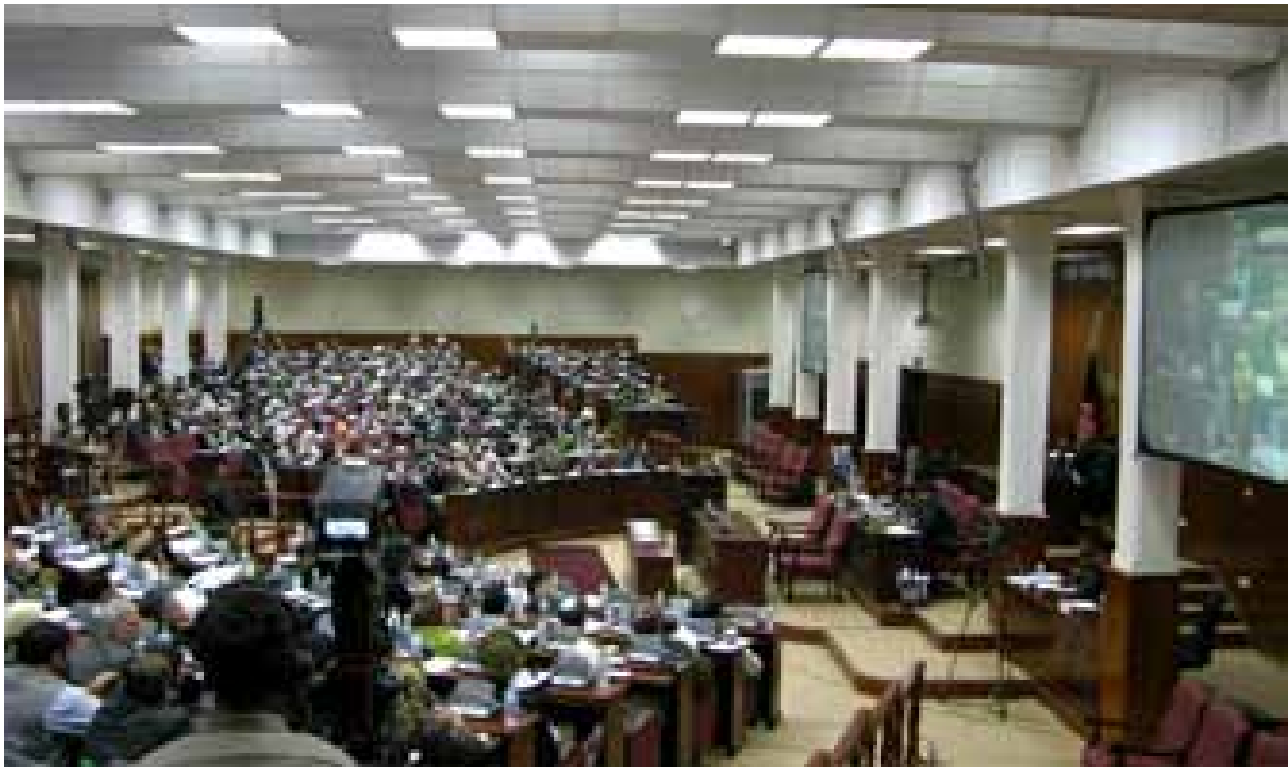
د ښځو جنسيتي گټې په پارلمان کې په کمه کچه زياتوالي مومي مگرلاتراوسه د تقنين په پروسه کې کومه اغېزه نلري ه

د ښځو جنسيتي گټې په پارلمان کې په کمه کچه زياتوالي