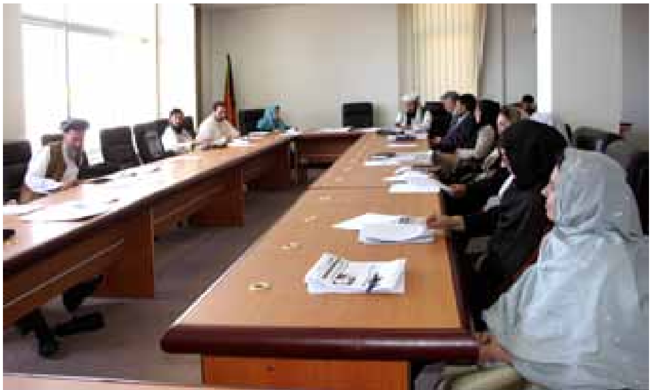
د پارلمان د کار د پیل په لومړي کال کې، د وزارتونو سره مکاتبي او د دوي د کارنو د څارلو په موخه ۱۸ کمیسیونونه جوړ شول. د ۱۸ کمیسیونو د مشرانو څخه ۳ یې ښځې دي.

”زه یوه پښتنه یم، مگر مخکې تر هغې چې پښتنه وم زه یوه ښځه یم. سره لدې هم ځینې ښځې فکر کوي چې زه یوه پښتنه یم مخکې تر هغې چې یوه ښځه وم.“ ۴۲