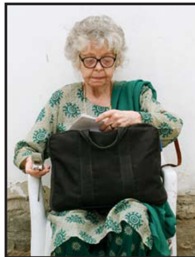
ننسی هچ دوپری